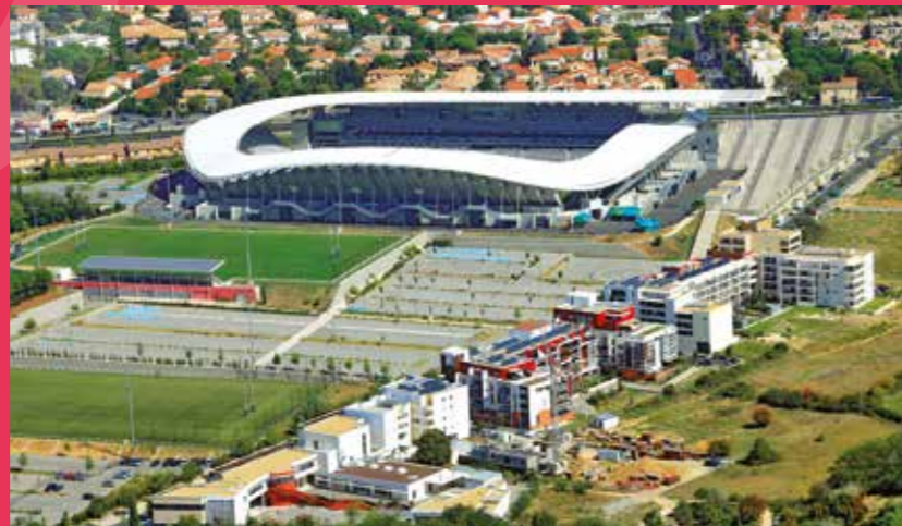
Complexe de rugby Yves du Manoir