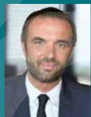
Michaël DELAFOSSE Maire de Montpellier Président de Montpellier Méditerranée Métropole

À l'ouest de Montpellier les quartiers sont marqués d'une empreinte forte qui a valeur de signature. Ovalie et Grisettes ont été réalisés avec passion, dans un esprit créatif et solidaire à la fois ; en préservant l'authenticité des sites et leurs hectares de vignes et nature attenantes qui s'invitent dans la ville, en y installant le berceau du rugby métropolitain, en les équipant d'un pôle santé nécessaire de ce côté de Montpellier.