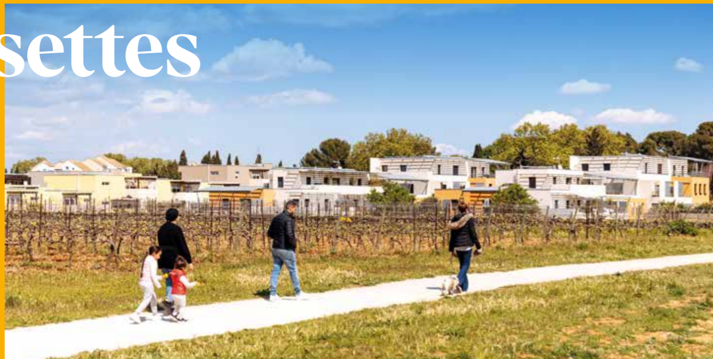
Agriparc du Mas Nouguier

La mixité sociale se traduit par des logements pour tous avec plus de 50% de logements locatifs sociaux ou destinés à l'accession aidée. L'économie se développe au travers de commerces de proximité, mais également des emplois générés par la venue de la clinique Saint-Roch en façade de l'avenue Pavelet. Quant à l'approche environnementale, elle s'illustre à travers la desserte du quartier par le tramway, un large réseau de pistes cyclables et de cheminements doux piétons, ou encore un système de chauffage urbain grâce à la récupération de la chaleur 100% écologique dégagée par le méthane de l'usine Amethyst.