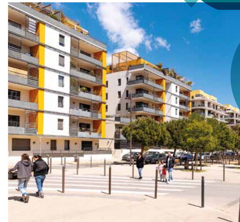
Rambla des Calissons

Pour la petite histoire, pourquoi avoir baptisé ainsi ce quartier ? Si l'on s'en tient à la stricte histoire du cru, la grisettes est le nom d'une friandise bien connue aux arômes de réglisse, miel et anis et enrobée d'une fine pellicule de sucre. Le plus vieux bonbon connu, entend-on ici et là (il daterait du XII e siècle).