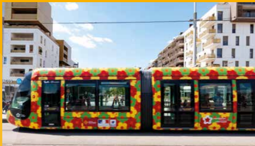
Station de tramway des « Sabines »