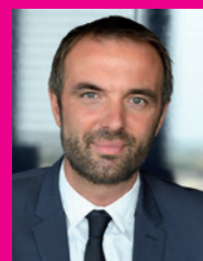
Michaël DELAFOSSE Maire de Montpellier Président de Montpellier Méditerranée Métropole

La Cité Créative sort de terre et affirme son ambition : devenir un véritable terrain d'échanges