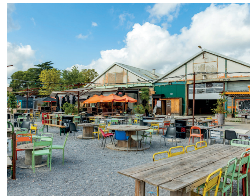
La Halle Tropisme

Situé à 1,5 km du centre-ville et de la gare de Montpellier Saint-Roch, la Cité Créative offre un second souffle à l'ancienne École d'Application de l'Infanterie, au parc Montcalm et aux quartiers avoisinants. Avec sa programmation mixte alliant logements, commerces, bureaux et équipements publics tels qu'un groupe scolaire, une crèche et un parc, et les industries culturelles et créatives, la Cité Créative apporte une dynamique nouvelle dans ce quartier de Montpellier.